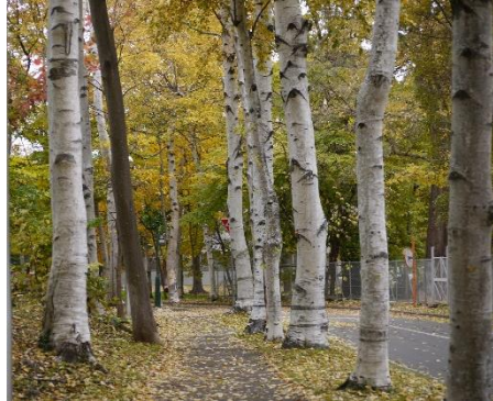
白樺の散歩道(北大構内)