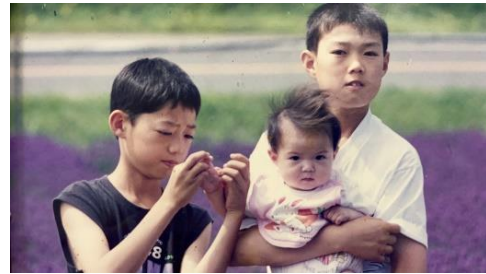
2人の兄と富良野にて

と決めていました。その強い意志もあり(笑)、無事に中学校の吹奏楽部でフルートを始めることができました。