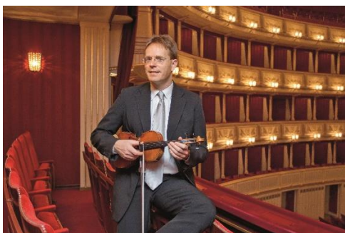
フォルクハルト・シュトイデ

マーラーの交響曲の中で2番、3番とともに、この曲は3部作としてとらえられている。その中で外見には軽量なのだが、他の2作品同様、楽章の中に声楽が含まれ、それが重要な役割を担ってマーラーの音楽的特徴を際立たせている。そして3曲とも、永久的な宗教的信念、あるいは人間の生き方についての真摯な考えが反映されている。それは三部作の縦糸となる「子どもの魔法の角笛」と密接に関係しているからだろう。4楽章でソプラノが天国の喜びを歌う部分で、作曲者の心情をじっくり味わっていただきたい。