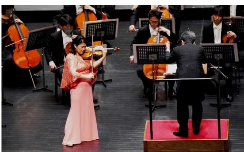
ヴァイオリン 竹澤恭子 指揮 高関健

これだけの名曲、名演だった故に、各楽器の音色が高度な次元で溶け合う、キラキラ・ホールで聴きたかったと思うのは僕だけではないだろう。