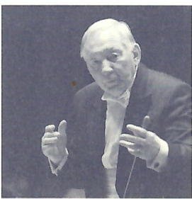
ラドミル・エリシユカ