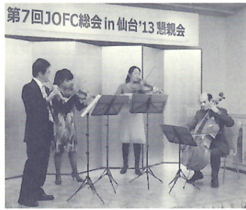
仙台フィル有志による歓迎演奏

二次会の会場、仙台駅南に隣接するSパル地下1階DIVERDE P.A.L仙台店に徒歩で移動、50余名が参加、札幌くらぶはここで1名が合流し、11名が参加した。二次会も親密さと和やかさで溢れ、11時少し前で終了、三次会に繰り出したグループと帰途に着いたグループに分かれた。