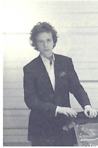
ニコライ・ホジャイノフ