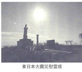
東日本大震災慰霊塔

仙台から札幌へ 昼食後、バスは仙台空港に向かい、札幌くらぶ8名は仙台空港で下車、被災地ツアーの一行と別れを告げ、札幌への帰途に着いた。バスは予定より早めに着いたので、予定の便より1便早めようとしたが、変更のできないチケットであったため、空港内で仙台名物の牛たんなどのお土産を購入したり、レストランでビールなど飲みながら過ごしたが、話が弾みアツという間に出発の時間となり、新千歳空港に向かい、到着後解散した。(事務局長 武藤義典)