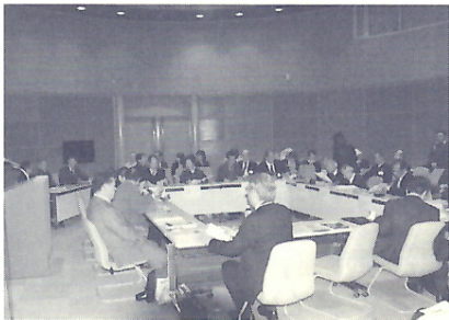
総会会場のエッグホール