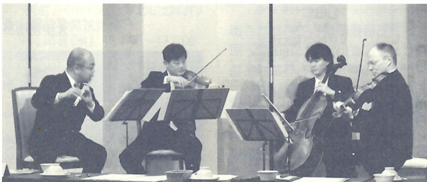
群響メンバーによる四重奏