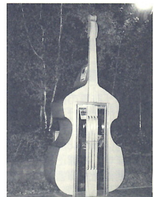
「群馬音楽センター」前にある公衆電話

翌日は総会でした。パーティやコンサートと違い緊張しましたが、群響の室内楽のサービスがあり、