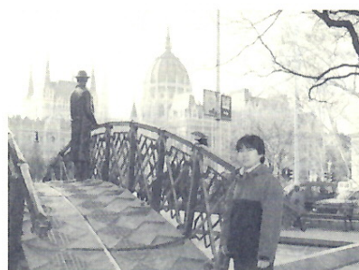
留学地ハンガリーにて

それから、大家さんがふるまってくれたハンガリー料理や世界遺産にも登録されているドナウ川の景色など、どれも素敵な思い出になっています。