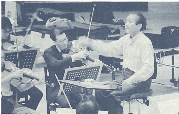
芸術の森アートホールでのバレエ音楽「ベトルーシユカ」のリハーサル風景

—— 15日は、札幌の定期としては、中島公園にできた新しいコンサートホールを使う、