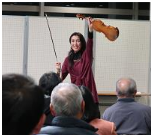
早来町民センターでの演奏とトーク