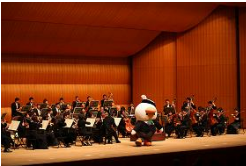
札幌苦小牧公演では苦小牧市のマスコット「とまちよっふ」が出演した。