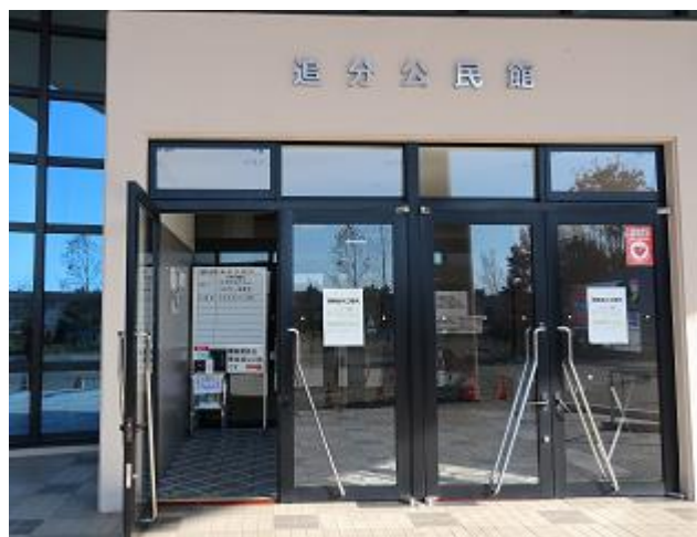
追分公民館 (入口に掲示)