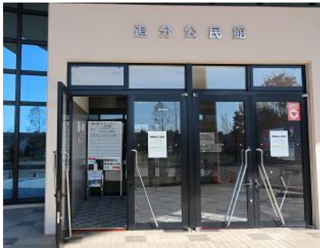
追分公民館（入口に掲示）